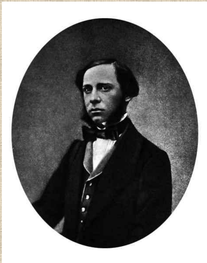
Михаил Салтыков в 1850-х годах.

«...Везде долг, везде принуждение, везде скука и ложь...» - такую характеристику дал он бюрократическому Петербургу. Другая жизнь более привлекала Салтыкова: общение с литераторами, посещение "пятниц" Петрашевского, где собирались философы, ученые, литераторы, военные, объединенные антикрепостническими настроениями, поисками идеалов справедливого общества.