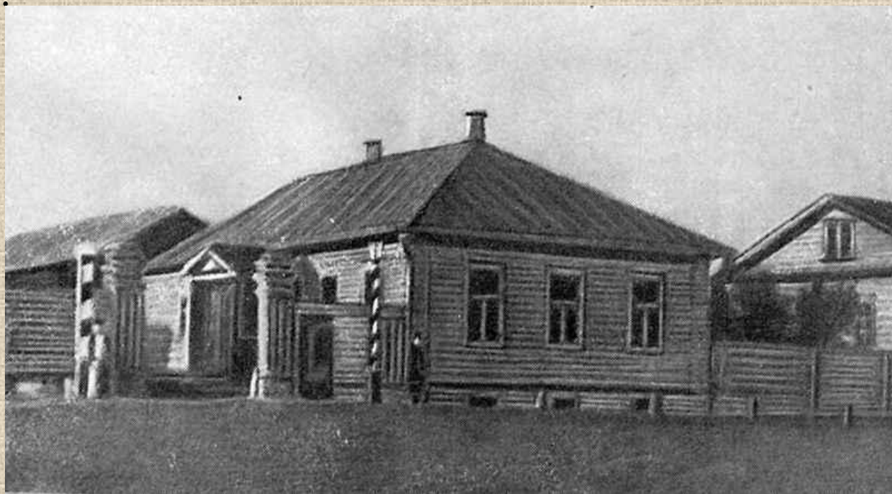
Дом в Вятке, где жил М.Е.Салтыков

В наказание за вольнодумие уже 28 апреля 1848 года он был выслан в Вятку (Киров) и 3 июля определён канцелярским чиновником при Вятском губернском правлении. В ноябре того же года он был назначен старшим чиновником особых поручений при вятском губернаторе, затем два раза занимал должность правителя губернаторской канцелярии, а с августа 1850 года был советником губернского правления. О службе его в Вятке сохранилось мало сведений, но, судя по записке о земельных беспорядках в Слободском уезде, найденной после смерти М. Е. Салтыкова в его бумагах, он горячо принимал к сердцу свои обязанности, когда они приводили его в непосредственное соприкосновение с народной массой и давали ему возможность быть ей полезным. В ноябре 1855 года ему разрешено было, наконец, покинуть Вятку.