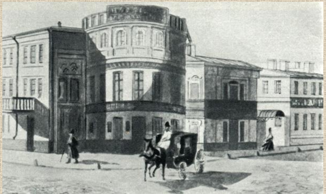
Московский дворянский институт