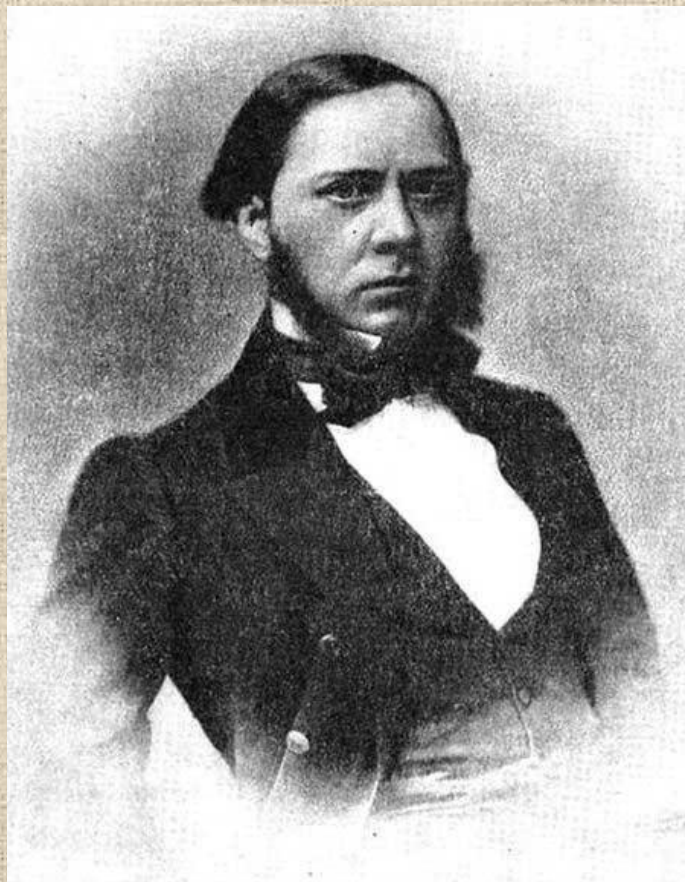
М.Е. Салтыков-Щедрин. Литография А. Мюнстера. 1850 г.г.