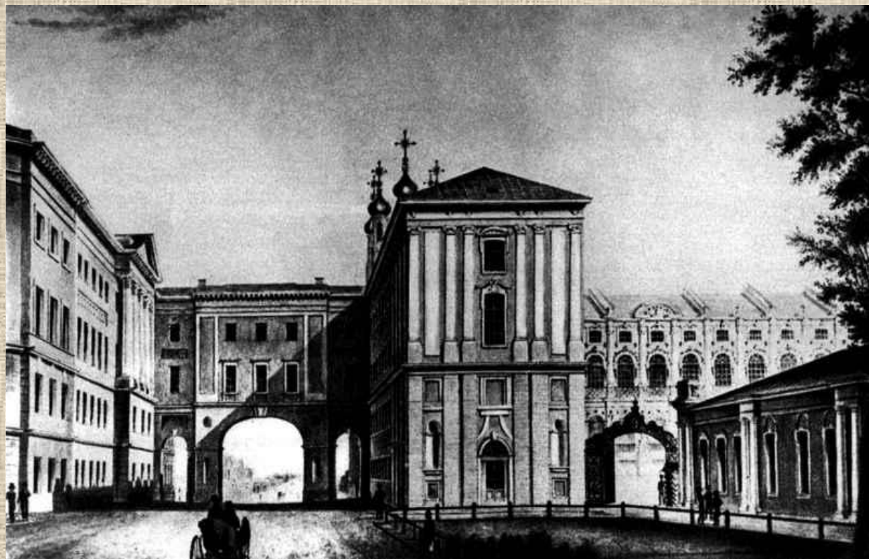
Императорский Царскосельский лицей

В 1844 году окончил лицей по второму разряду (то есть с чином X класса). В лицее под влиянием свежих ещё тогда Пушкинских преданий каждый курс имел своего поэта; на XIII курсе эту роль играл Салтыков. Несколько его стихотворений было помещено в «Библиотеке для чтения» 1841 и 1842 годов, когда он был ещё лицеистом; другие, напечатанные в «Современнике» в 1844 и 1845 годах, написаны им также ещё в лицее. М. Е. Салтыков скоро понял, что у него нет призвания к поэзии, перестал писать стихи и не любил, когда ему о них напоминали.