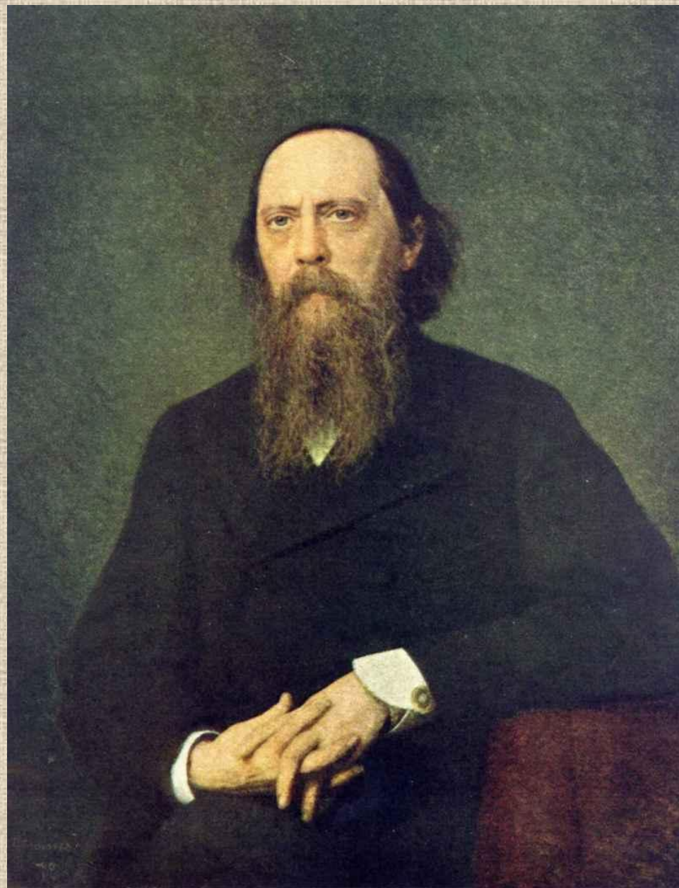
М.Е.Салтыков-Щедрин. Художник И.Н.Крамской.

Михаил Евграфович Салтыков-Щедрин 1826 - 1889