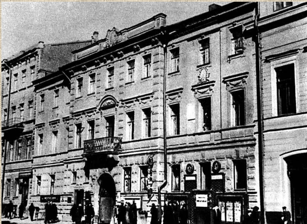
Дом в Петербурге, где жил М.Е.Салтыков

В 1862 году писатель вышел в отставку, переехал в Петербург и стал редактором «Современника» — его пригласил Николай Некрасов, который на тот момент руководил журналом. Каждый месяц Салтыков-Щедрин выпускал обозрение «Наша общественная жизнь», но через два года покинул редакцию из-за внутренних разногласий и вернулся на государственную службу. В 1865–1868 годах он возглавлял Казенные палаты в Пензе, Туле и Рязани. В то же время Салтыков писал памфлеты-гротески, в которых начальники этих мест узнавали себя. Из-за этого у писателя часто возникали конфликты с местными властями, и ему приходилось менять место службы. После жалобы рязанского губернатора в 1868 году его окончательно отправили на пенсию. В 1869-м Салтыков-Щедрин выпустил «Письма о провинции», в которых рассказал о своих наблюдениях за жизнью этих городов.