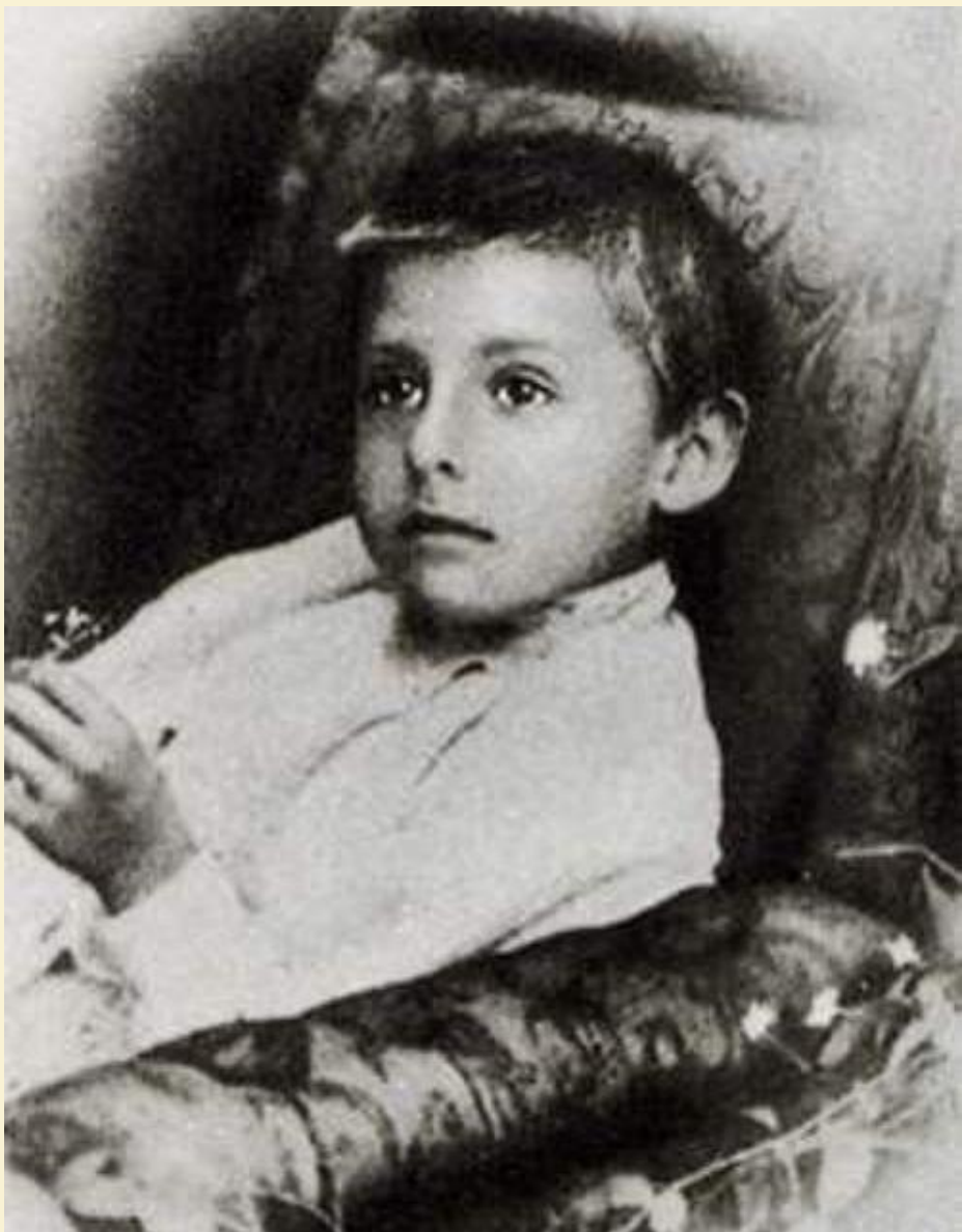
Иван Бунин в детстве