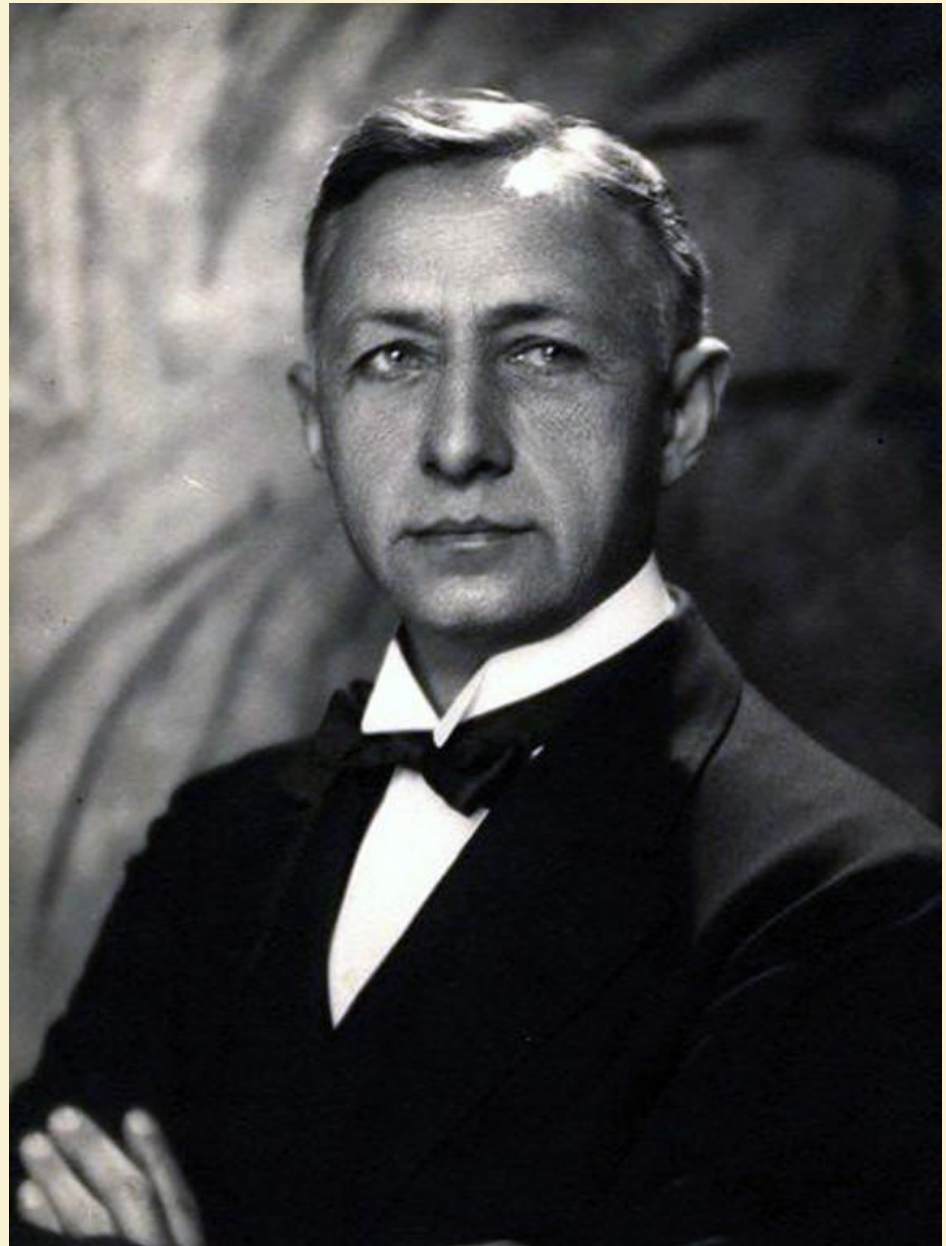
И.А. Бунин. 1928 г.

В 1933 году Иван Бунин завершил самое значительное произведение зарубежного периода творчества — роман «Жизнь Арсеньева». Именно за него в этом же году Бунину присудили Нобелевскую премию по литературе. Имя автора стало всемирно известным, но слава его была омрачена тем, что в Советской России это достижение замалчивалось, а его произведения не печатали. Полученные от Шведской академии средства не сделали Бунина богатым. Значительную часть премии он отдал нуждающимся.