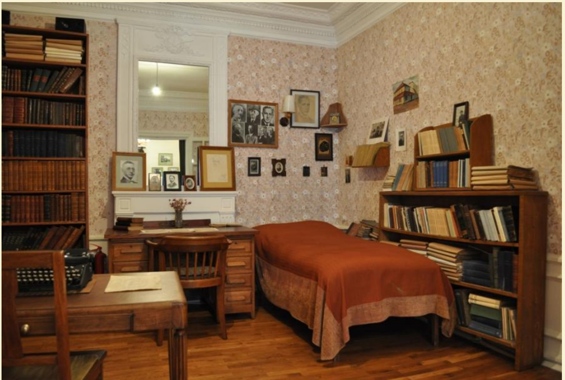
Парижский кабинет И.А.Бунина, воссозданный в мемориальном музее И.А.Бунина (г. Орел)