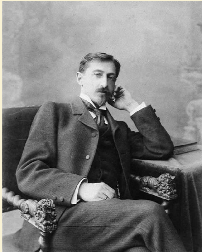
И.А. Бунин. 1901 г.

Иван Бунин много путешествовал и учил в зарубежных поездках иностранные языки. Так писатель стал переводить стихи. Среди авторов были древнегреческий поэт Алкей, Саади, Франческо Петрарка, Адам Мицкевич, Джордж Байрон, Генри Лонгфелло. Параллельно он продолжал писать сам: в 1898 году выпустил поэтический сборник «Под открытым небом», через три года — сборник стихов «Листопад». За «Листопад» и перевод «Песни о Гайавате» Генри Лонгфелло Бунин получил Пушкинскую премию Российской академии наук (19 октября 1903 года).