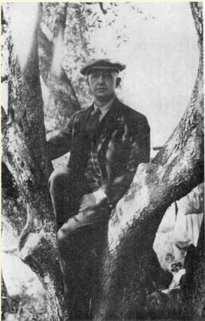
И.А. Бунин. Грас, 30-е годы