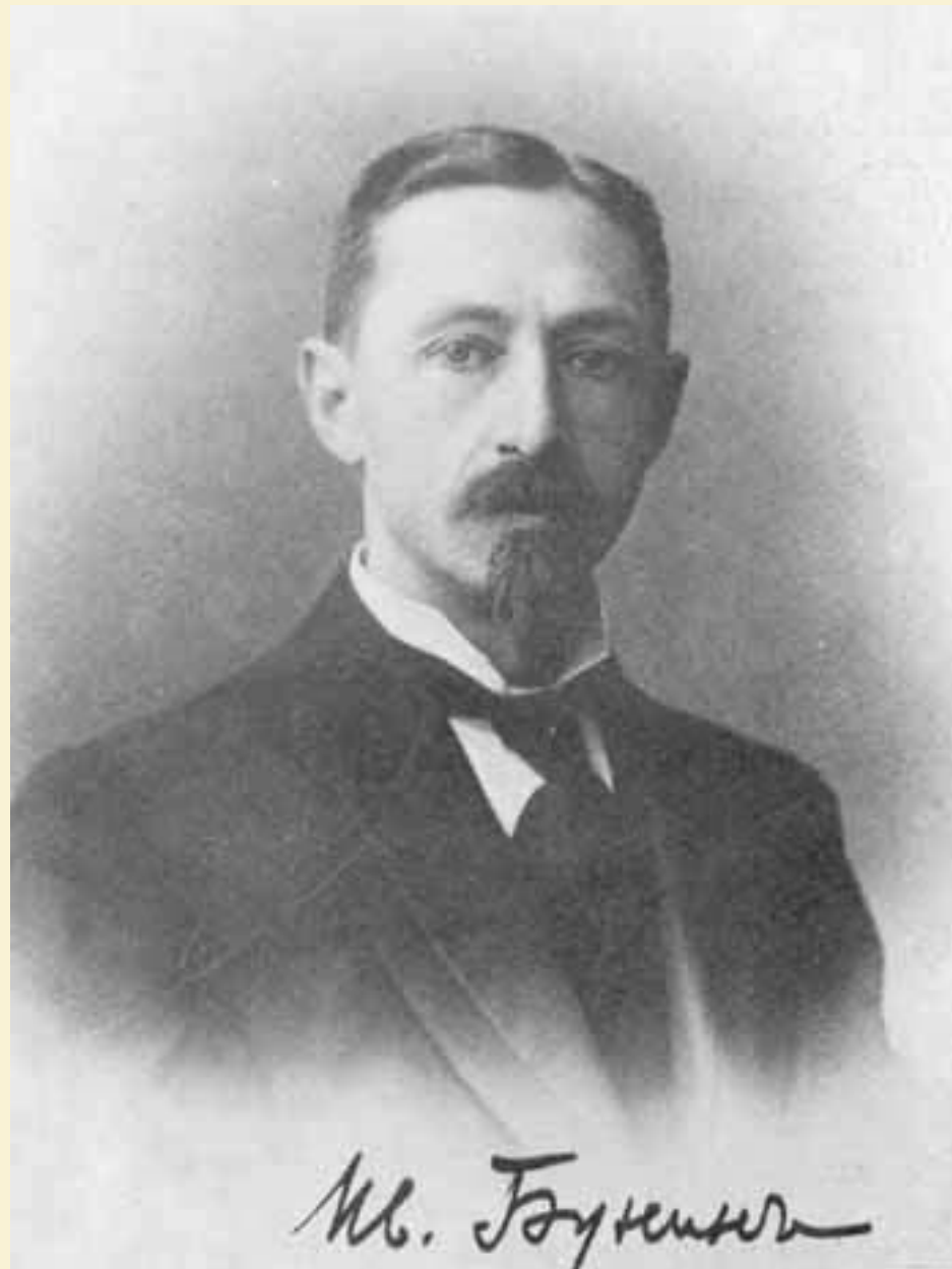
И.А. Бунин. 1915 г.