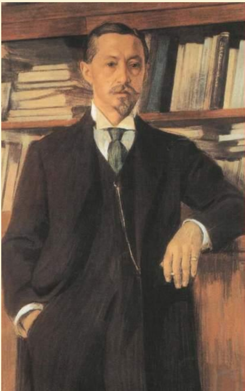
И.А. Бунин. Портрет работы В.Россинского