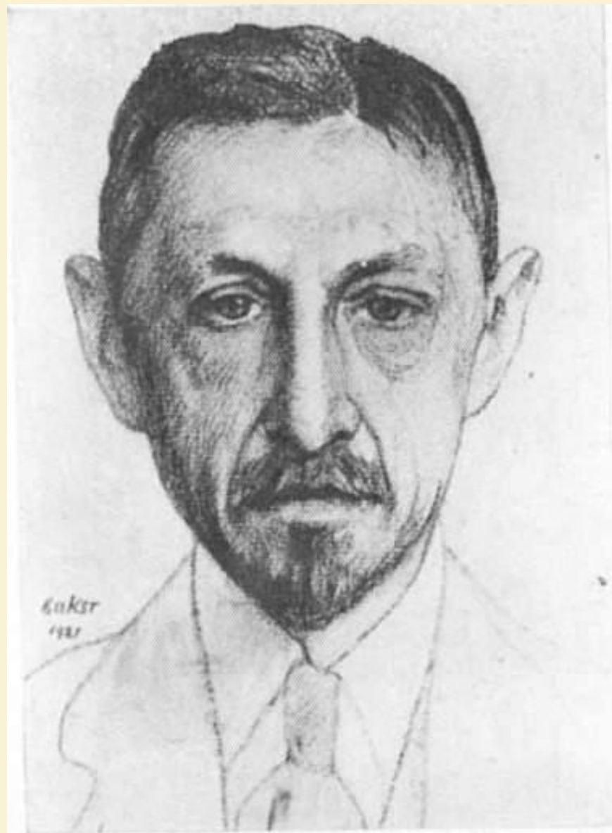
И.А. Бунин. Париж. 1921 г.