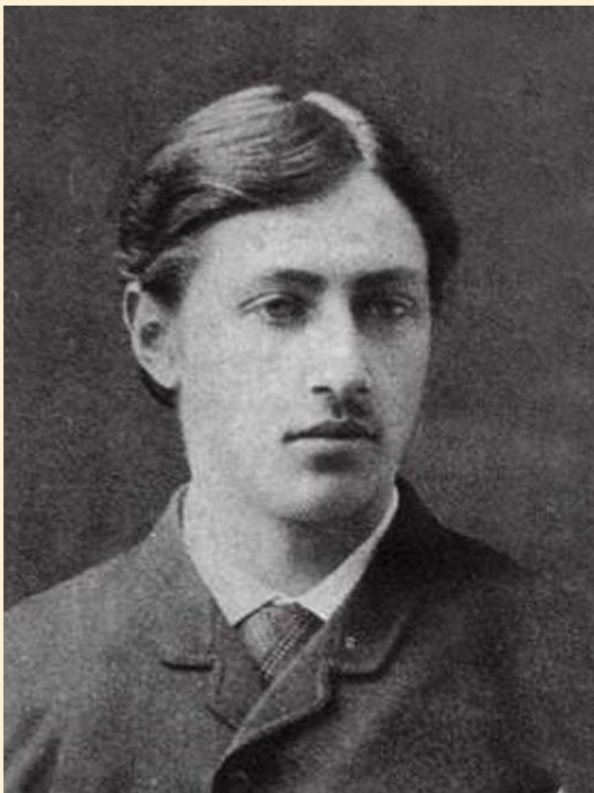
Иван Бунин. 1889 г.

Первые стихи Бунина были опубликованы в 1888 году.