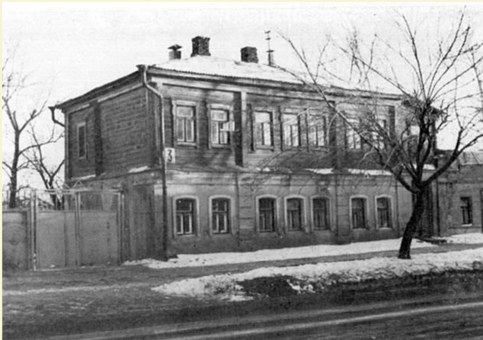
Воронеж. Дом, в котором 22 октября 1870 года родился Иван Алексеевич Бунин