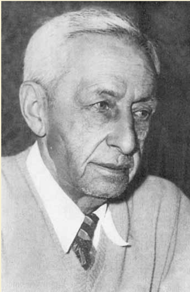
И.А. Бунин. 1948 г.

В мае 1945 года Бунины прибыли в Париж, где встретили день победы над фашистской Германией. Здесь же в 1946 году они узнали о своем восстановлении в гражданстве СССР и даже хотели вернуться. В письме прозаику Марку Алданову Бунин писал: «Но и тут ждет нас тоже нищенское, мучительное, тревожное существование. Так что, как никак, остается одно: домой. Этого, как слышно, очень хотят и сулят золотые горы во всех смыслах. Но как на это решиться? Подожду, подумаю...» Но после Постановления «О журналах «Звезда» и «Ленинград» 1946 года, в котором Центральный комитет СССР раскритиковал творчество Михаила Зощенко и Анны Ахматовой, литератор передумал возвращаться.