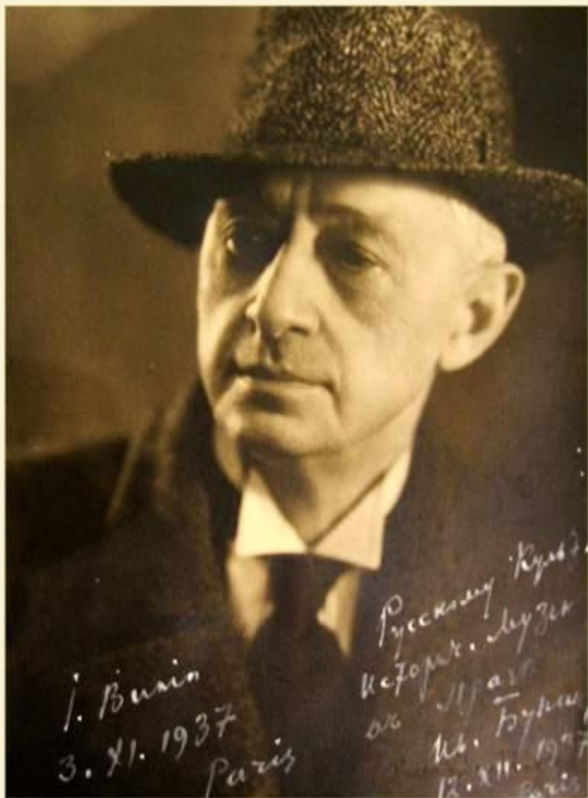
И.А. Бунин. 1937 г.

Вторая мировая война застала Буниных во французском городе Грас. К тому моменту деньги от Нобелевской премии закончились, и семье приходилось жить впроголодь.