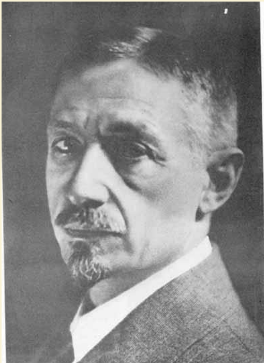
И.А. Бунин. Париж. 1920 г.