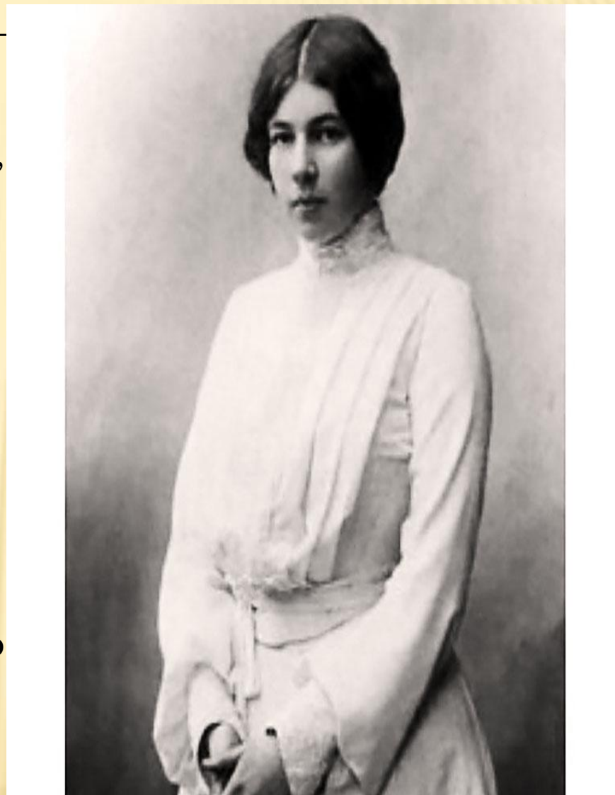
Любовь Менделеева. Фото 1906 г.