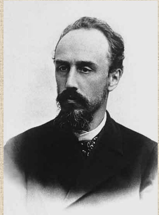
Александр Львович Блок — отец поэта. Фото 1900-х г.