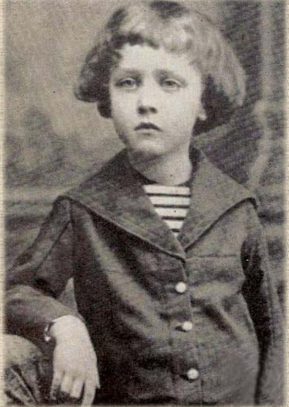
Александр Блок в детстве. 1885 год.