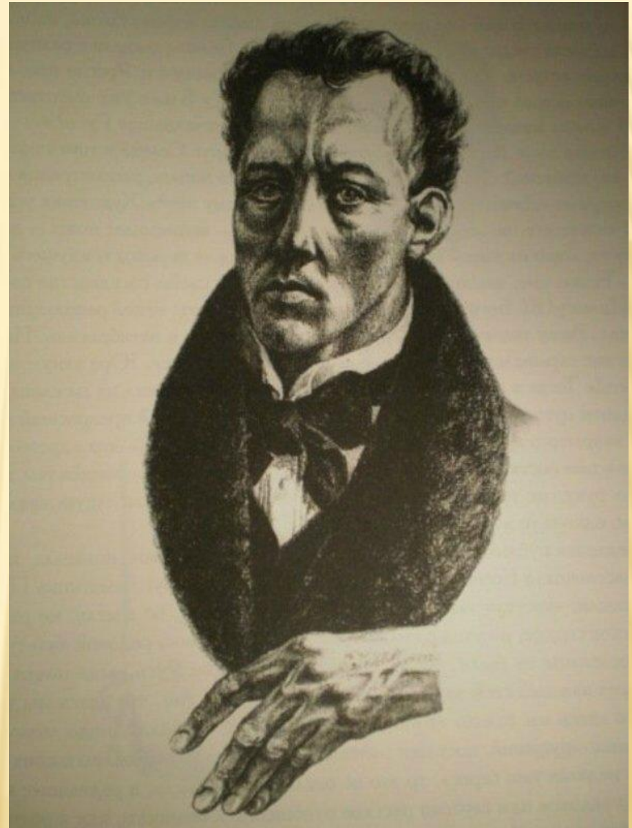
Ю.И.Селивёрстов. Портрет А.А.Блока.