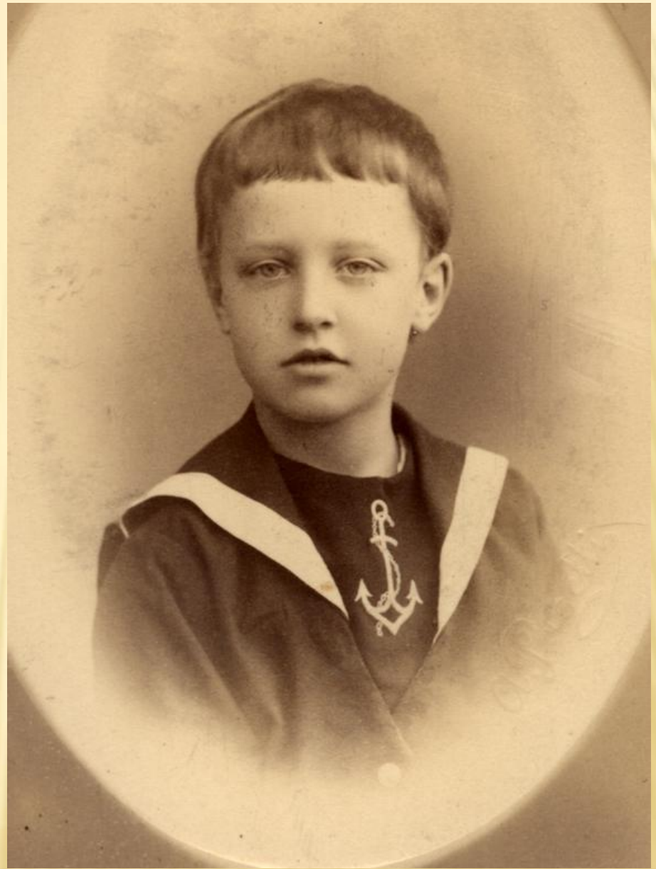
Александр Блок. Фото 1887 г.

Первые стихи будущий поэт написал в пятилетнем возрасте. Маленький Саша сочинял небольшие стишки и рассказы, которые аккуратными печатными буквами переписывал в альбомы. Почти все детские «сборники» мальчик посвятил матери, о чем свидетельствовали сделанные им надписи. Год от года увлечение становилось всё более сильным. В одиннадцать лет он пишет даже небольшой поэтический цикл. Но серьезно Александр стал относиться к творчеству только к восемнадцати годам. На тот момент в его «копилке» было уже около восьмисот стихотворений.