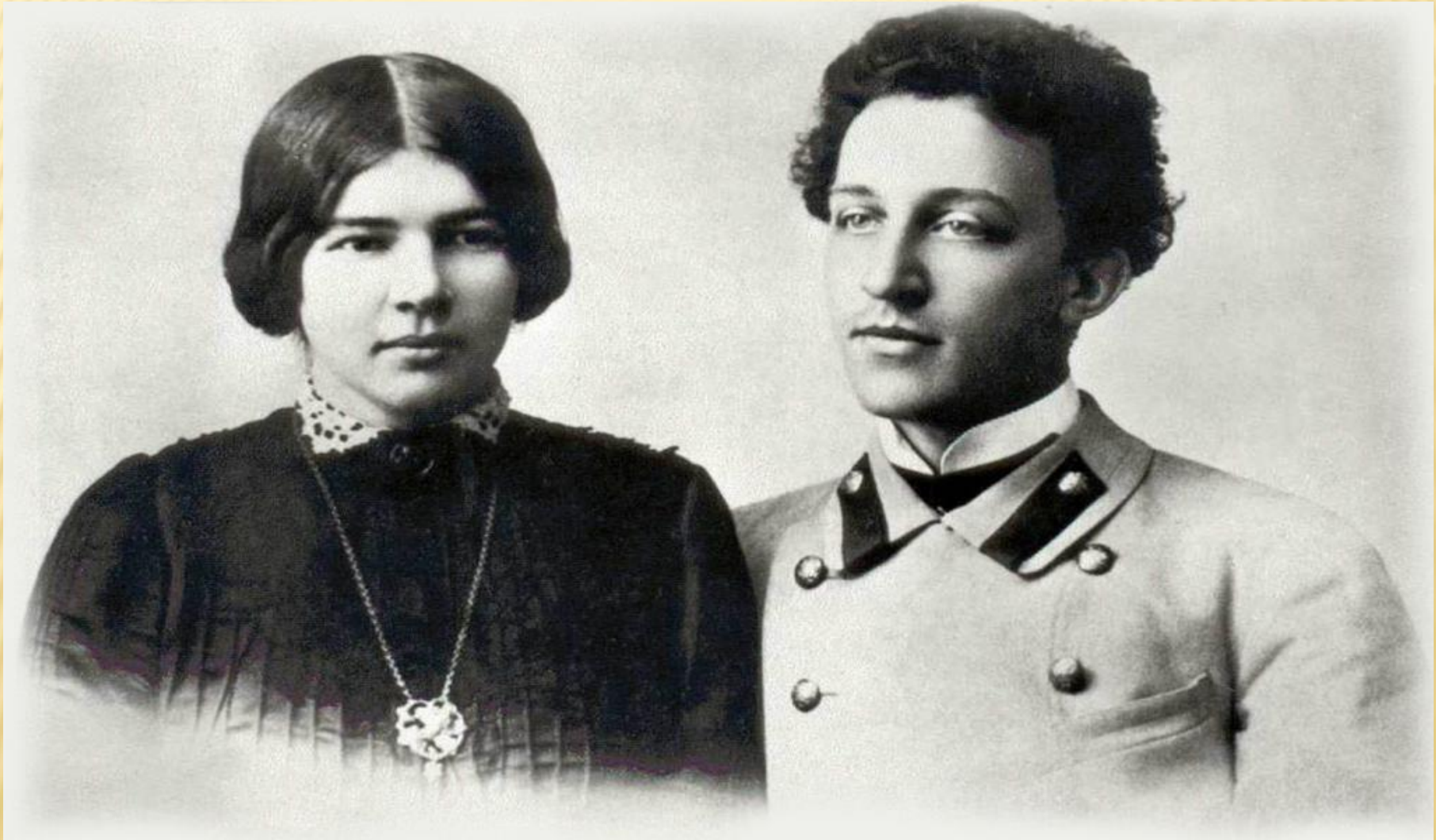
Александр Блок и его жена Любовь Менделеева. Фото 1903 г.

В 1903 году Александр Блок обвенчался с Любовью Менделеевой. Они были знакомы на тот момент восемь лет, около пяти лет Блок был влюблен в неё. Вскоре в «Северных цветах» вышел цикл «Стихи о Прекрасной Даме».