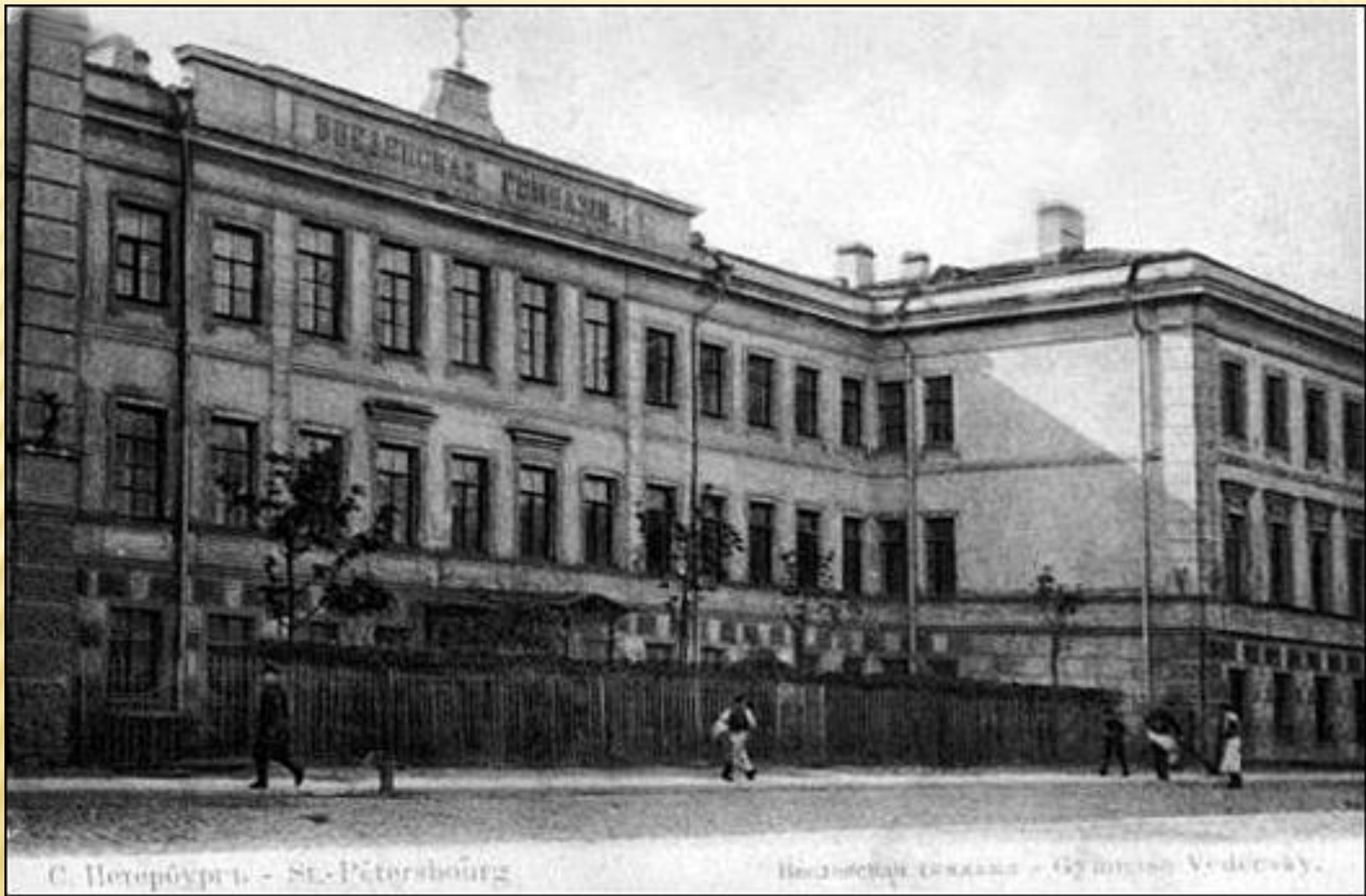
Введенская гимназия, где в 1891-1898 г.г. учился Александр Блок.